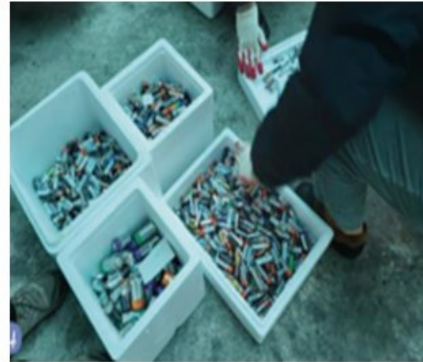
폐건전지 수거 - 새건전지 교환