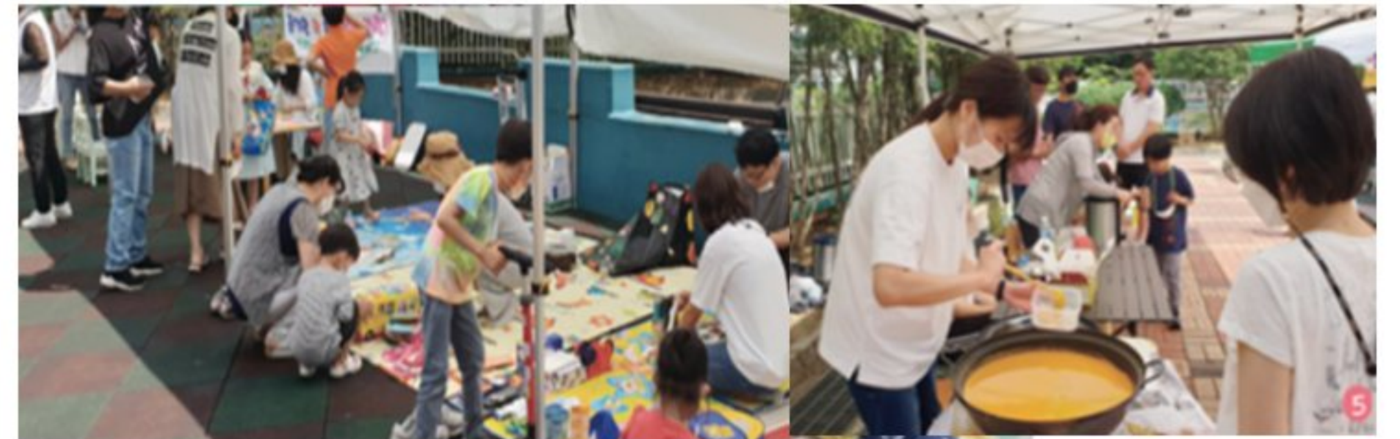
친환경 장터 운영 (중고품 나눔 판매, 다회용기 활용 먹거리 장터)