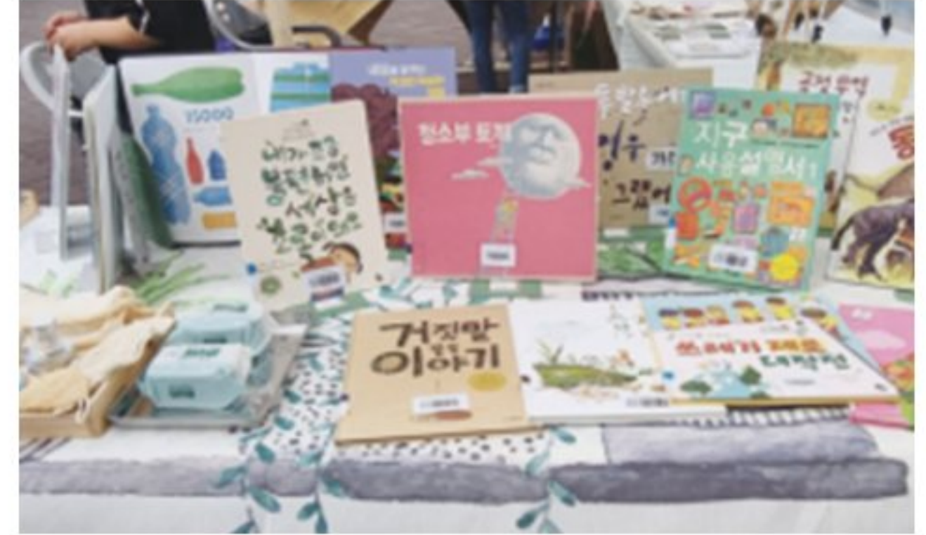
생태 환경 동아리 운영 (생태환경 그림책 북큐레이션)