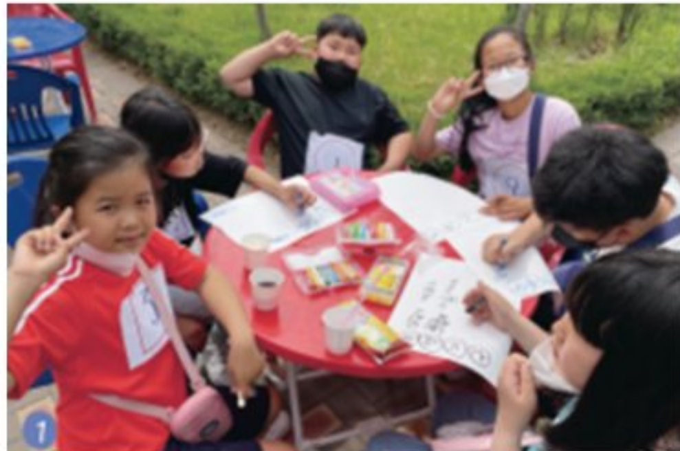
녹색지구 4행시 짓기 행사 (어린이날 행사 연계)