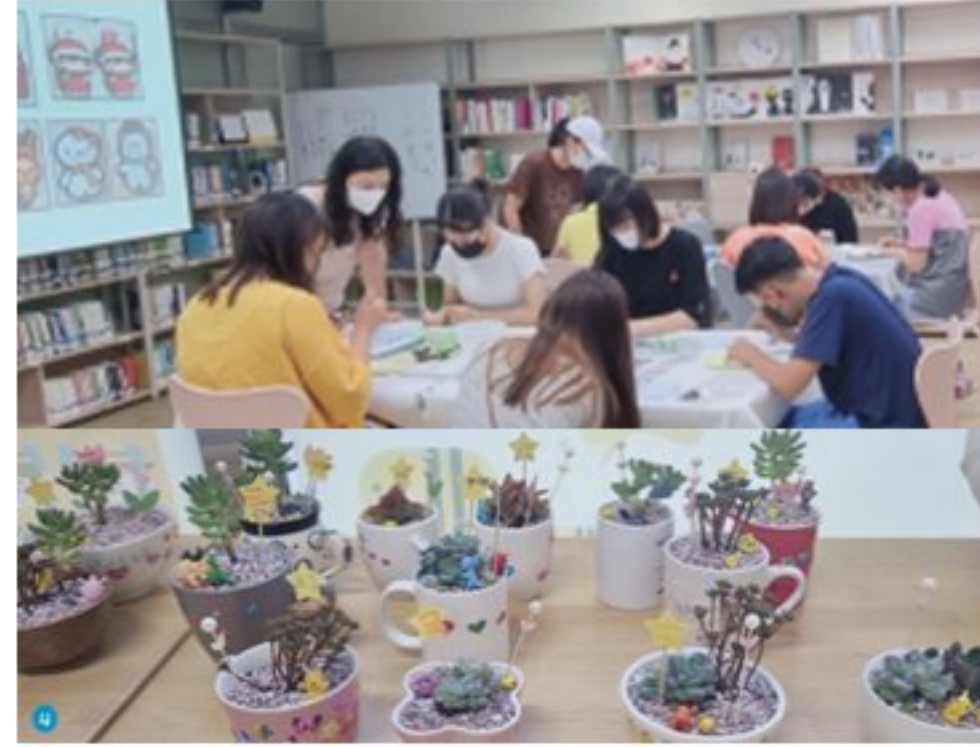
버려지는 물건 재활용 체험