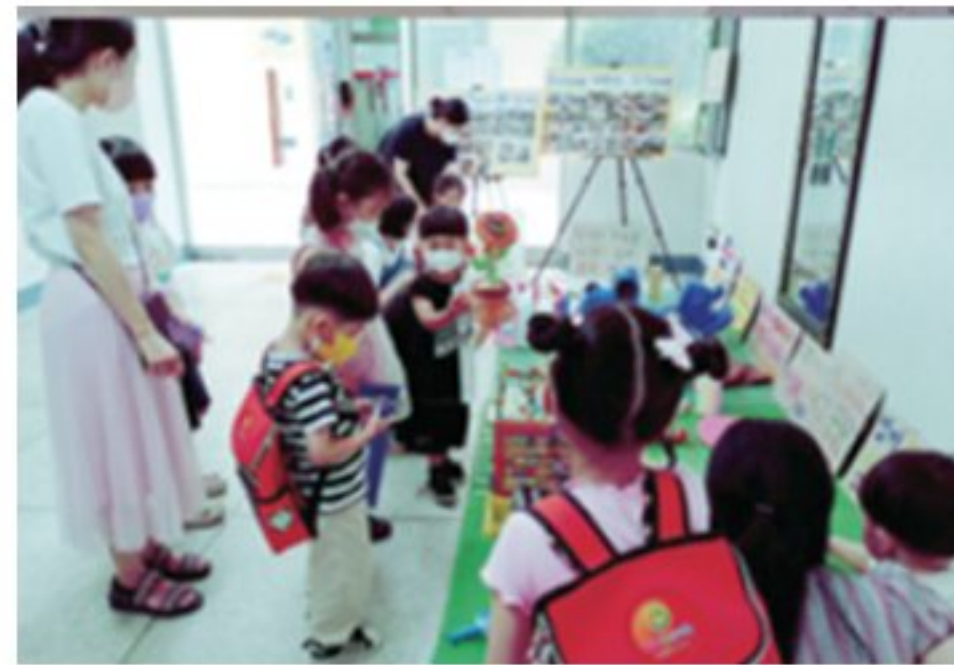
친환경 무인 장터 (어린이집 견학 연계)