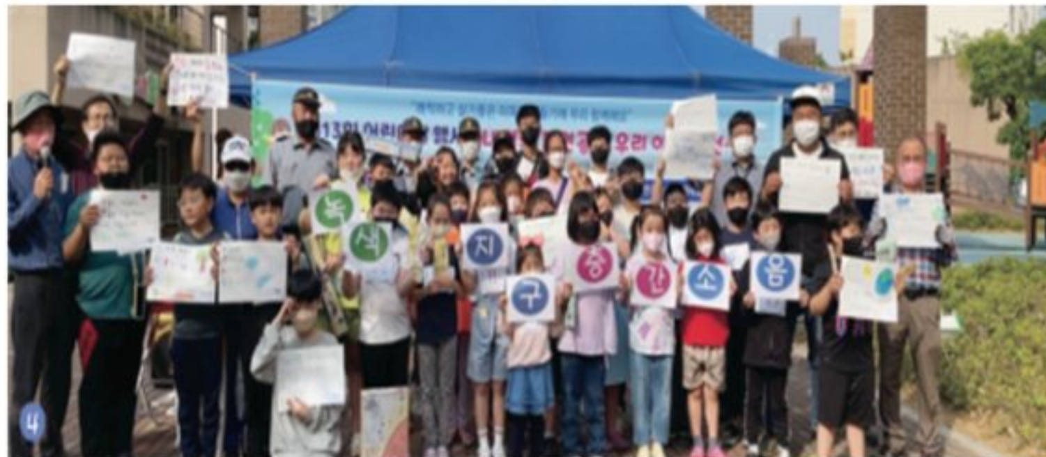
아파트 봉사당과 함께하는 녹색지구 만들기 홍보 캠페인