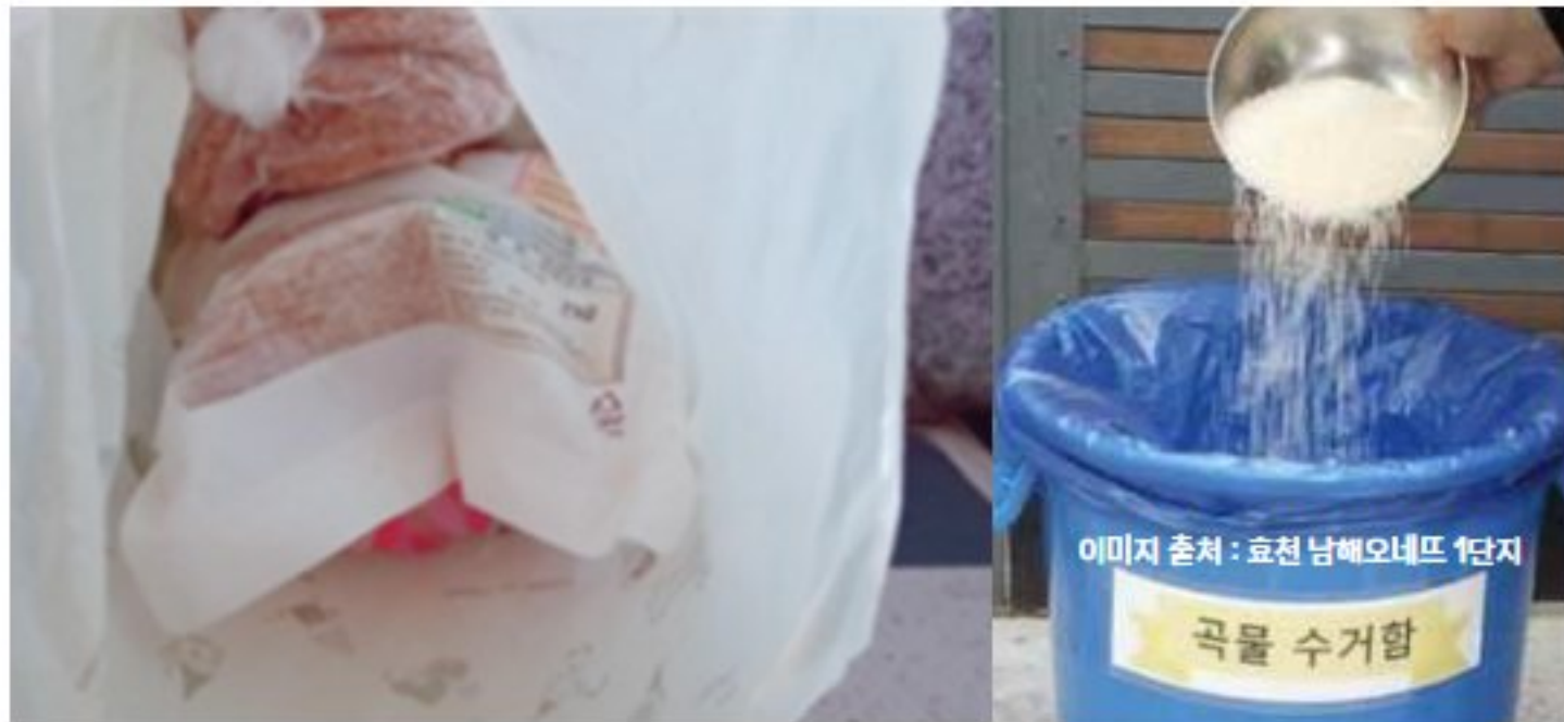
폐곡물 수거 후 나눔