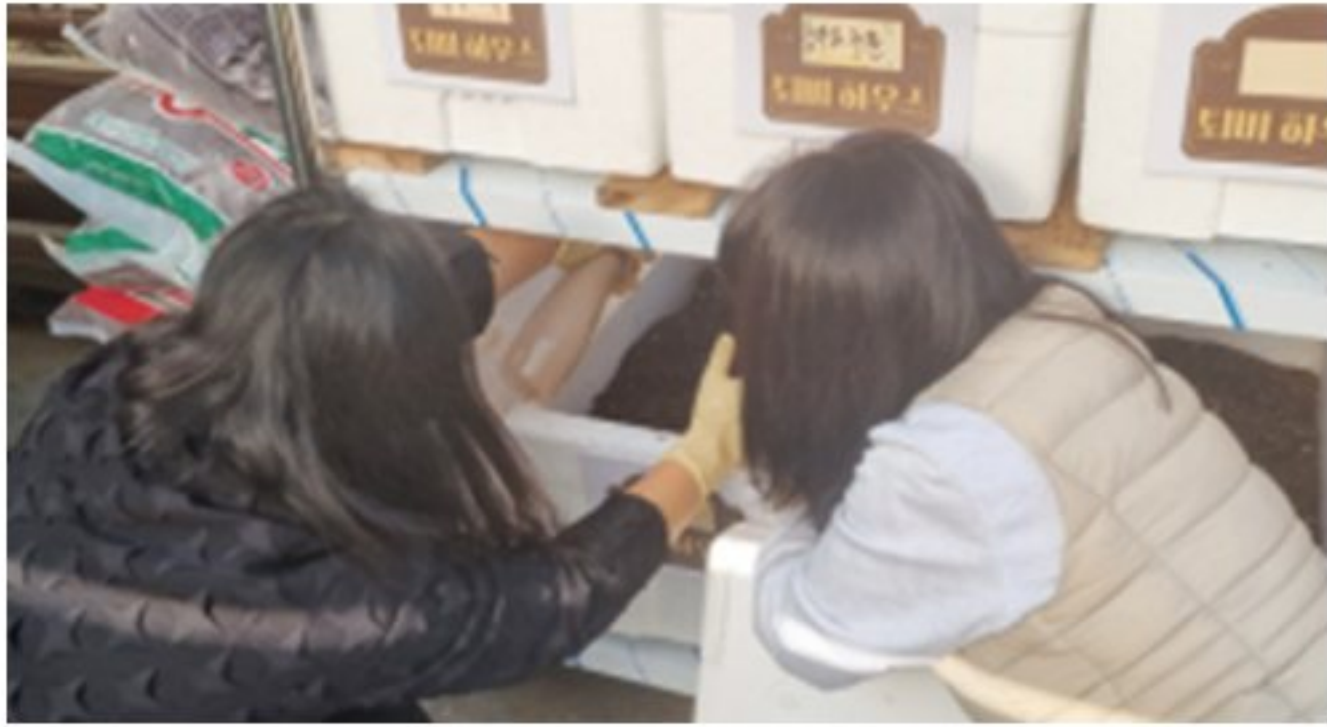
지렁이 퇴비 하우스 운영