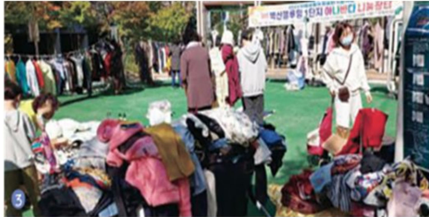
아나바다 장터 운영