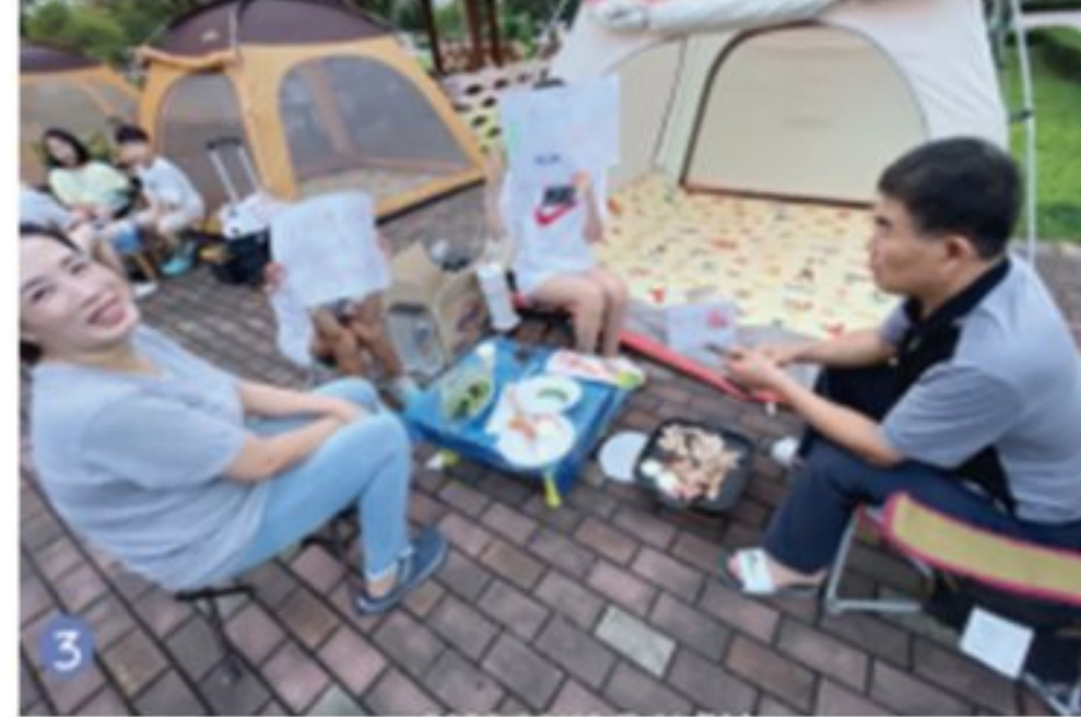
우리집 에너지 절약 캠프 (1박2일 에너지없는 텐트 체험)